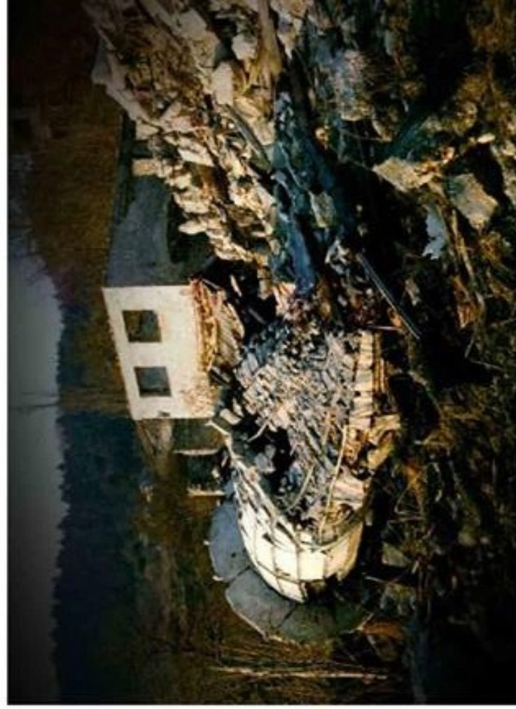
Občianska vojna v Bosne. Zničený minaret.

V otázkách národnostních a spolupatričnosti ke státu se mi zdá, že co platilo v socialistické Jugoslávii, se lišilo od toho, co bylo realitou v socialistickém Československu. Na rozdíl od meziválečného období, kdy se prakticky v Jugoslávii mluvilo hlavně o třech národech, tedy o Srbech, Chorvatech a Slovincích, dostávaly po roce 1945 postupně důležitější úlohu i jiné národy jugoslávské společnosti. Představa o „jugoslávském národu“ nebyla jen prázdňé slovo. Otázkou však je, jak moc se např. občan chorvatské národnosti tehdy cítil nejřív jugoslávцем a až potom Chorvatem. Dalo by se říci, že události zvlášť po roce 1991 ukázaly, že se státem, ve kterém žilo, se víc ztotožňovalo obyvatelstvo srbské, černohorské, a částečně makedonské i muslimské. Myslím si, že v Československu nebyly tak silné pokusy budovat jednotný národ jako v Jugoslávii. A to bez ohledu, že se postavení slovenského národa v socialistickém Československu lišilo, a řekli bych také zlepšilo od jeho postavení za první československé republiky.