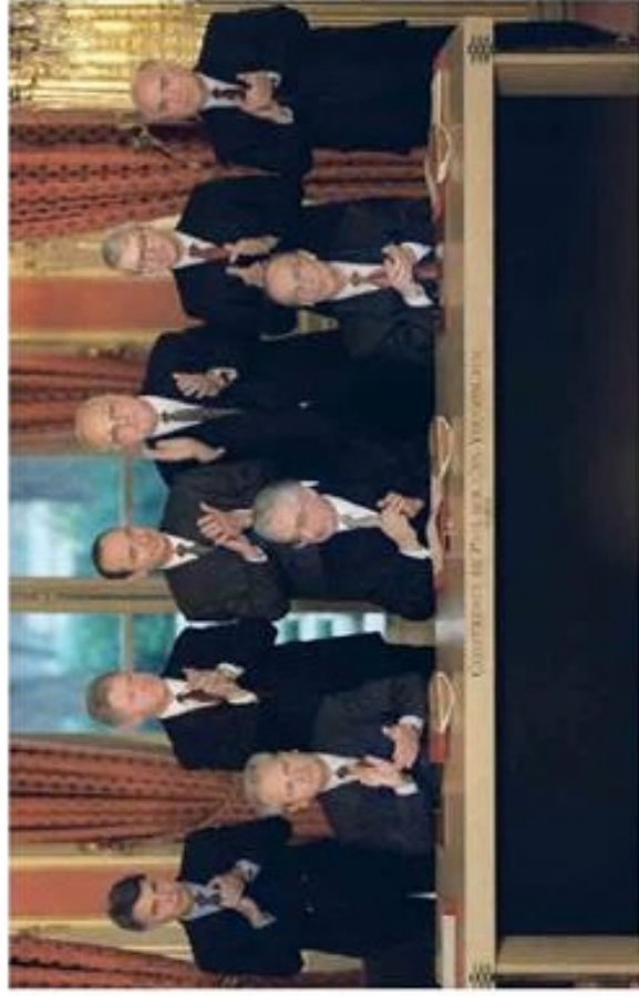
Franjo Tuđman, Slobodan Milošević a Alija Izetbegović. Daytonská dohoda 1995.