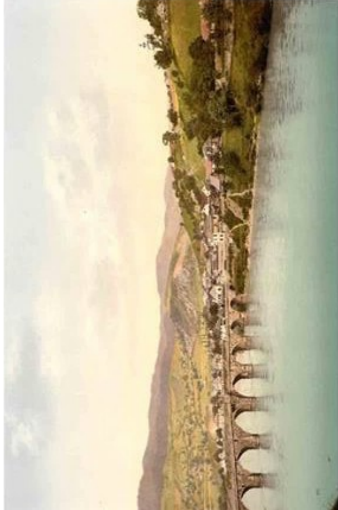
1577. Most Mehmed-paše Sokolovića. Pýcha osmanskéj architektúry na území Bosny, UNESCO (na dobovej pohľadnici).

Ako hodnotíš súčasné tendencie v rámci vzťahov krajín bývalej Juhoslávie a kde by si videl možnú eskaláciu národnostného napätia?