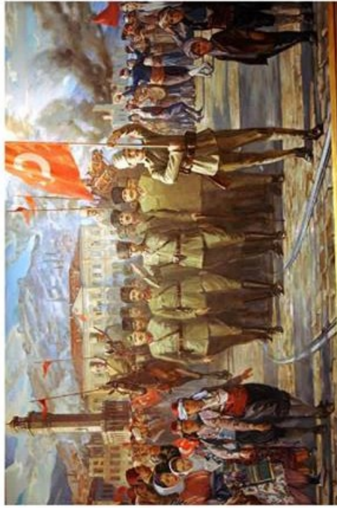
Turecké jednotky vchádzajú do Smyrny. Grécko-turecká vojna.